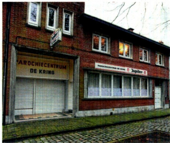
Zaal De Kring heeft dringend nood aan een grondige opknapbeurt.