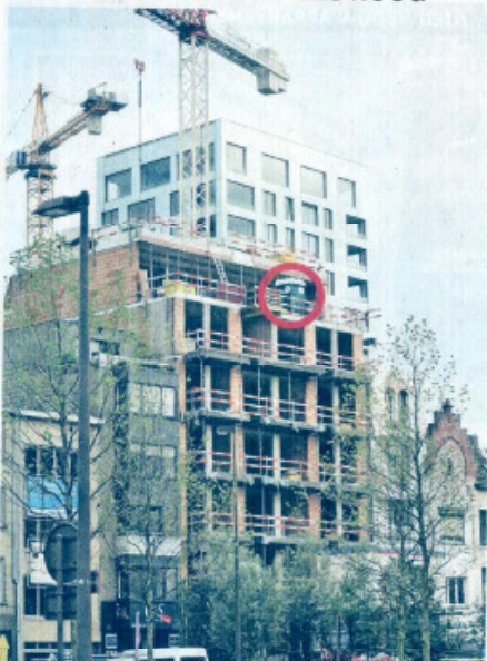
Met een urinoir op de zesde verdieping (cirkel) moeten de arbeiders niet naar beneden als het dringend is.

De arbeiders die op deze werf in de Amsterdamstraat aan de slag zijn, kunnen maar beter geen hoogtevrees hebben als de nood het hoogst is. Ongetwijfeld staat het stevig verankerd, maar zoals dit werfvoel er vanop de begane grond uitziet, lijkt het haast alsof het staat te balanceren op een balkon.