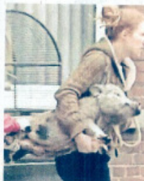
Een uitgemergeld varken wordt weggedragen.

«Vuile pampers van maanden ver, etensresten, lege verpakkingen... het ligt er overal verspreid. Daar tussen kinderbedjes die duidelijk recent nog werden beslapen.» De drie kinderen - naar verluidt, tussen 2 en 5 jaar oud - gingen tot en met vrijdag nog naar de lefschool De Eekhoortjes in Ledegem, maar doken deze week niet